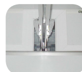
Passage pour rail