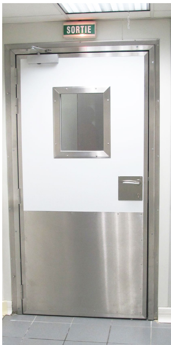
Photo non contractuelle (Avec options sur cette photo : protection basse)