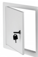
Fermeture à clé